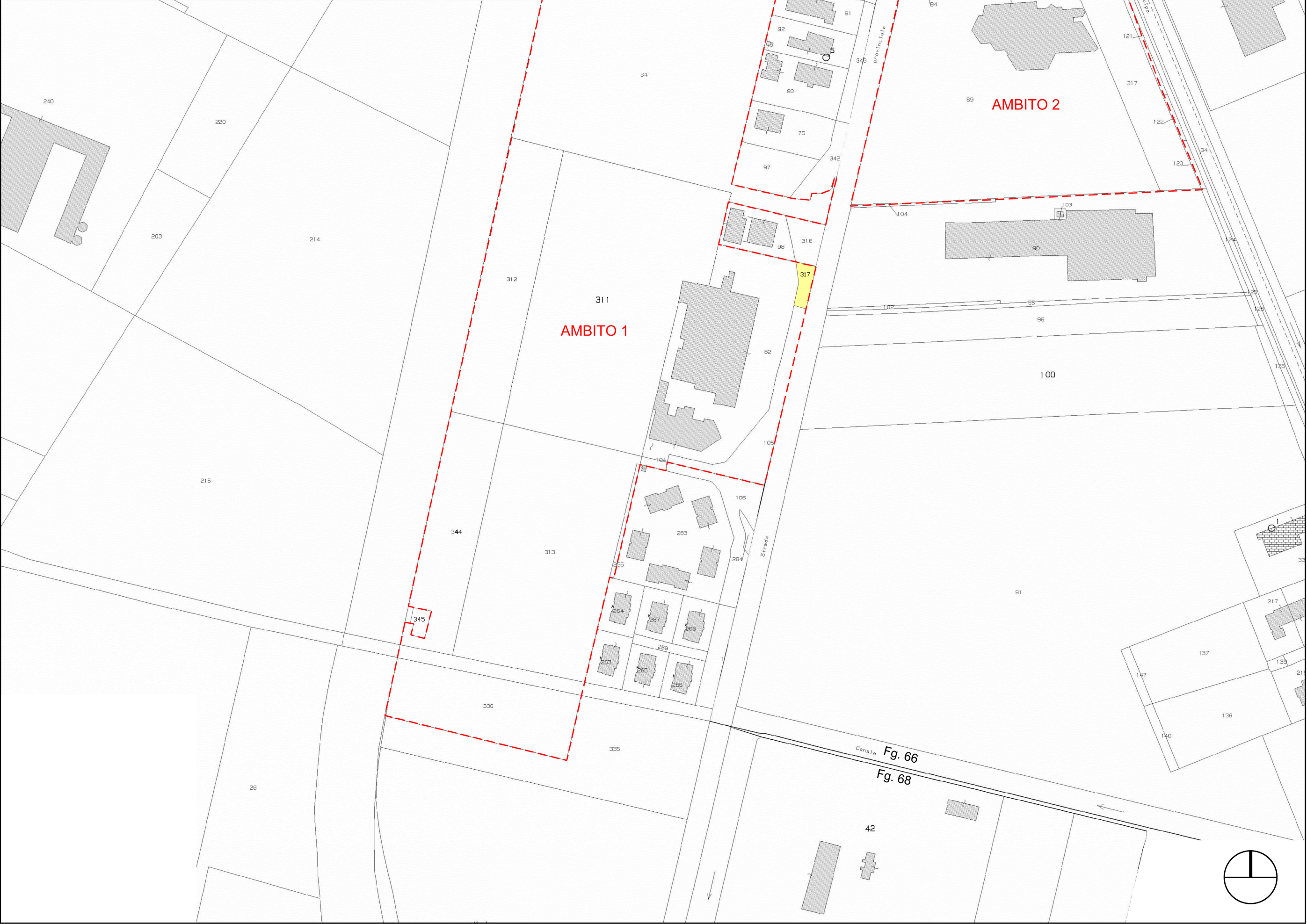
ESTRATTO DI MAPPA – Foglio 66 e 68