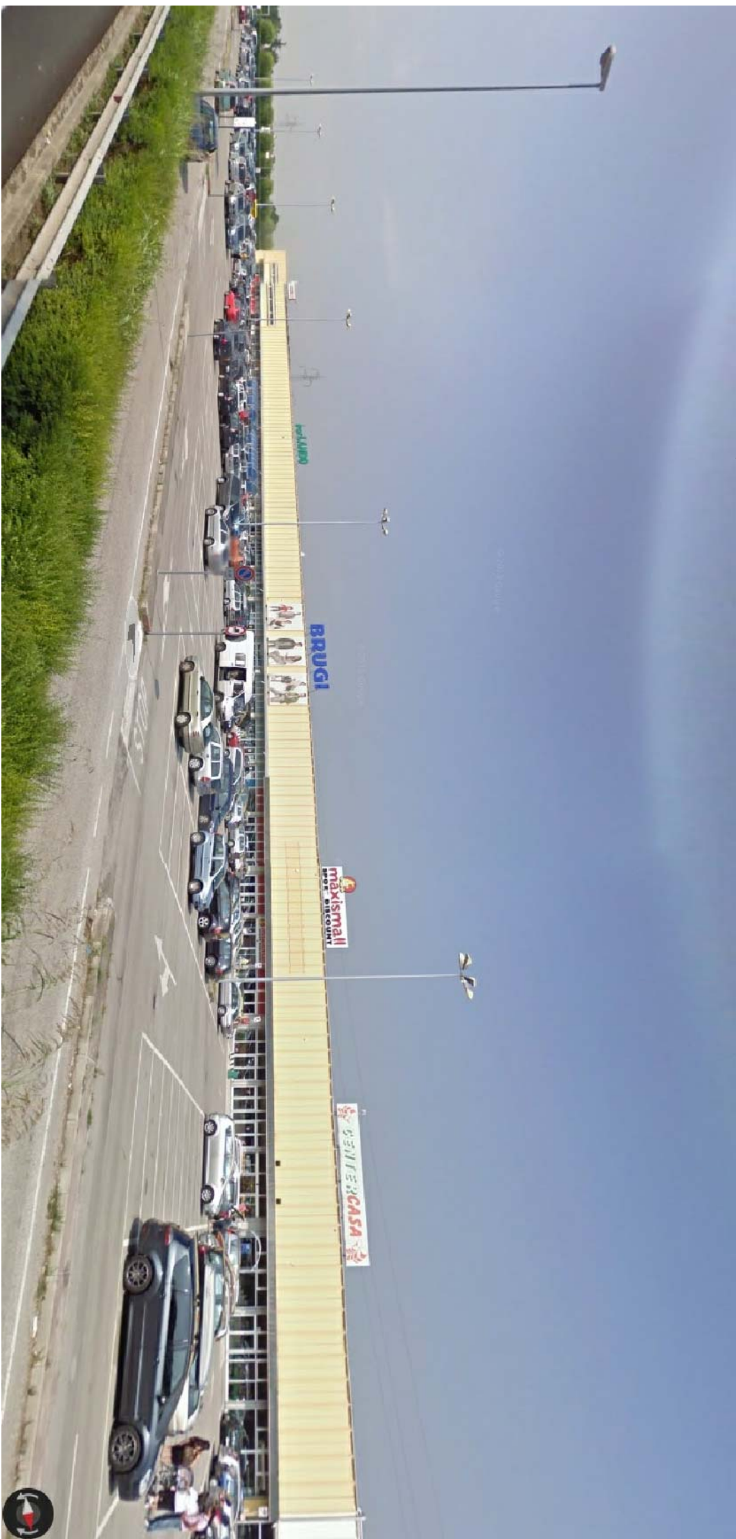
② VISTA DA SUD - INIZIO PROPRIETA' PROPONENTE

STATO ATTUALE PROGETTO DI RIQUALIFICAZIONE