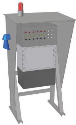
CONSOLLE PER AZIONAMENTO BRACCIO

- sistema di sicurezza intrinseca che opera lo sganciamento automatico del braccio, senza generare rilasci di GPL, in caso di stress meccanico superiore ai valori progettuali consentiti ( ad esempio, per anomali movimenti/oscillazioni della nave in scarico).