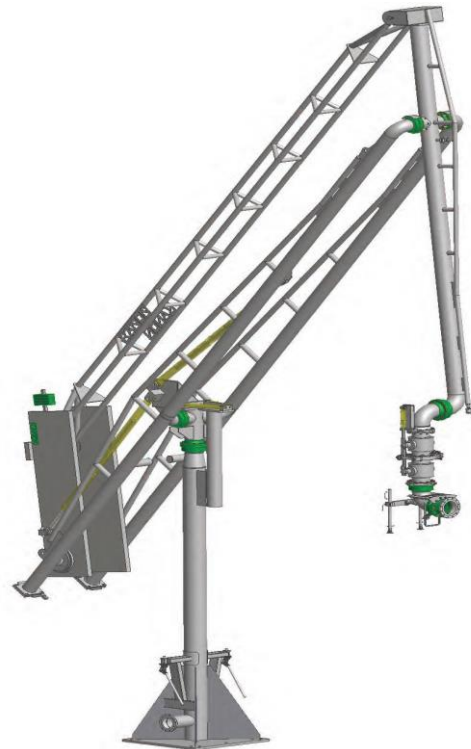
BRACCIO DI TRAVASO PER SCARICO NAVE GASIERA

Le attività di connessione/ sconnessione del braccio alla nave gasiere saranno effettuate da personale del Deposito sotto la supervisione del Responsabile del Deposito stesso. Le attività di pompaggio così come il controllo completo delle operazioni di trasferimento del GPL dalla nave, saranno effettuate da personale della nave stessa.