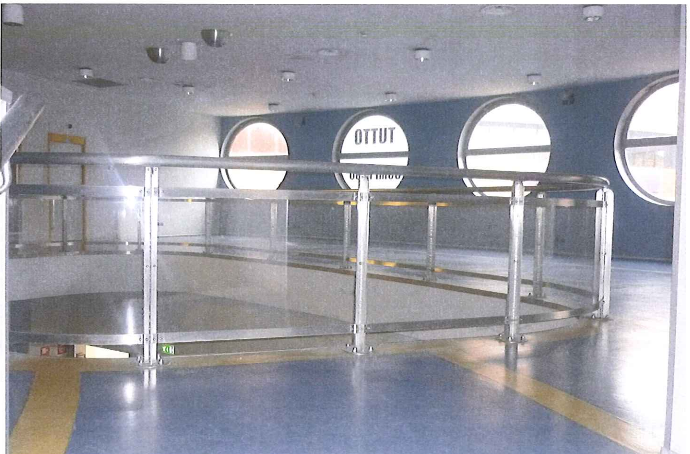
Fabb.E vista interna P.1.