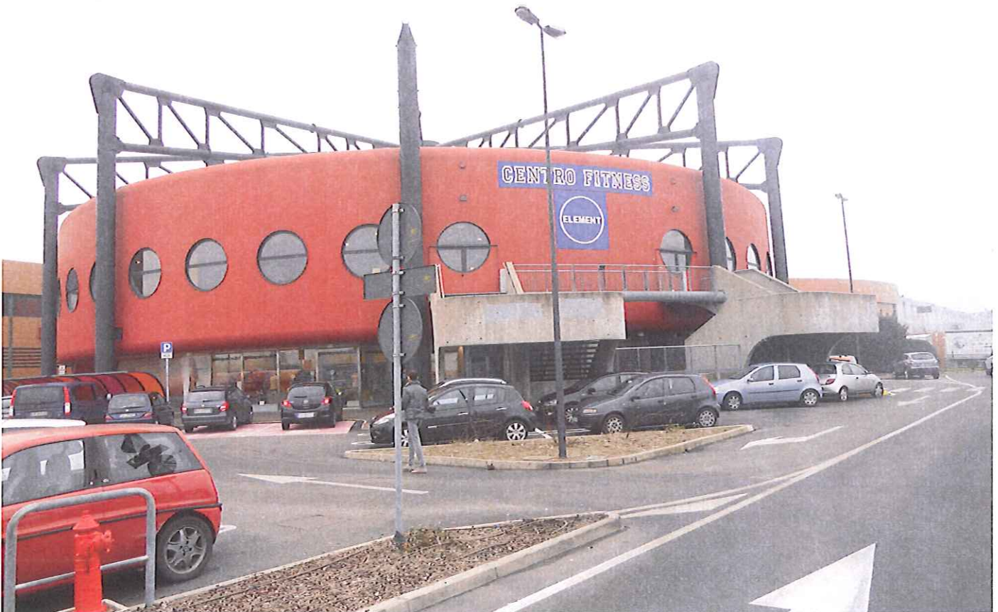
Fabb. E vista da nord-ovest