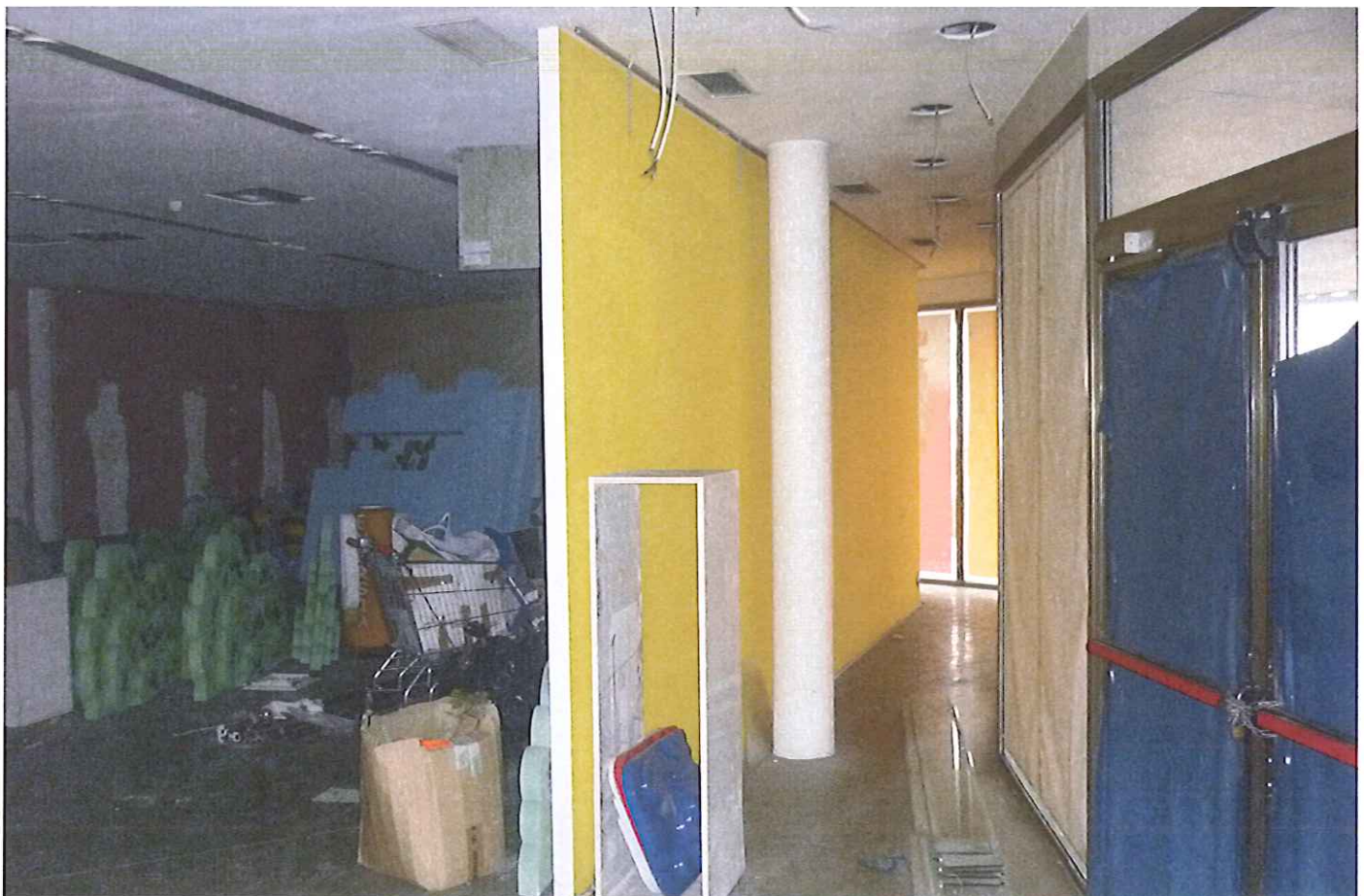
Fabb.E vista interna P.1.