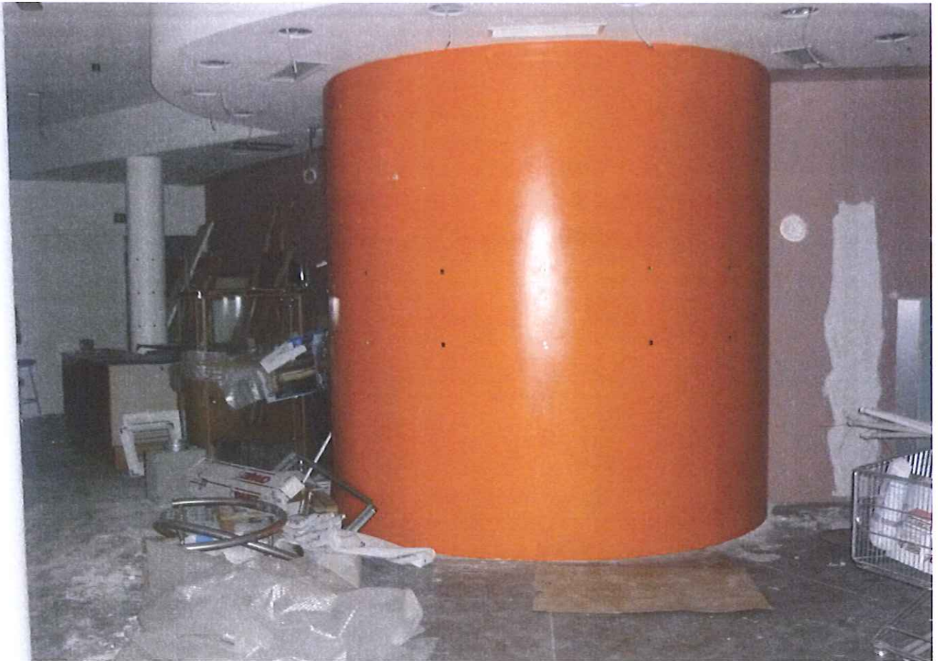
Fabb.E vista interna P.1.