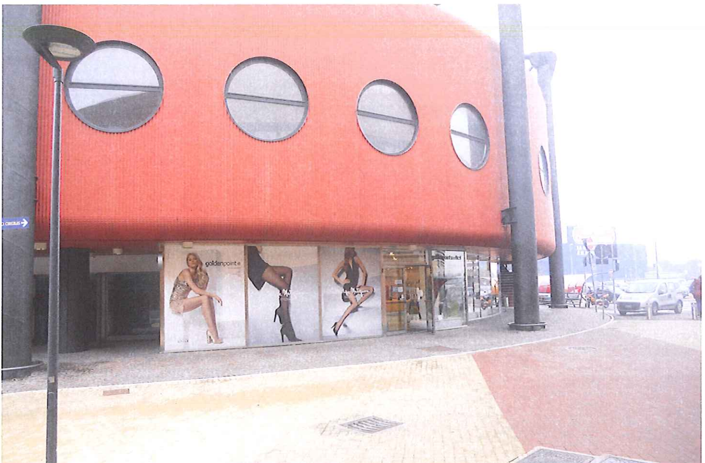
Fabb. E vista da est