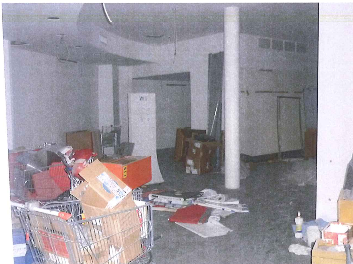
Fabb.E vista interna P.1.