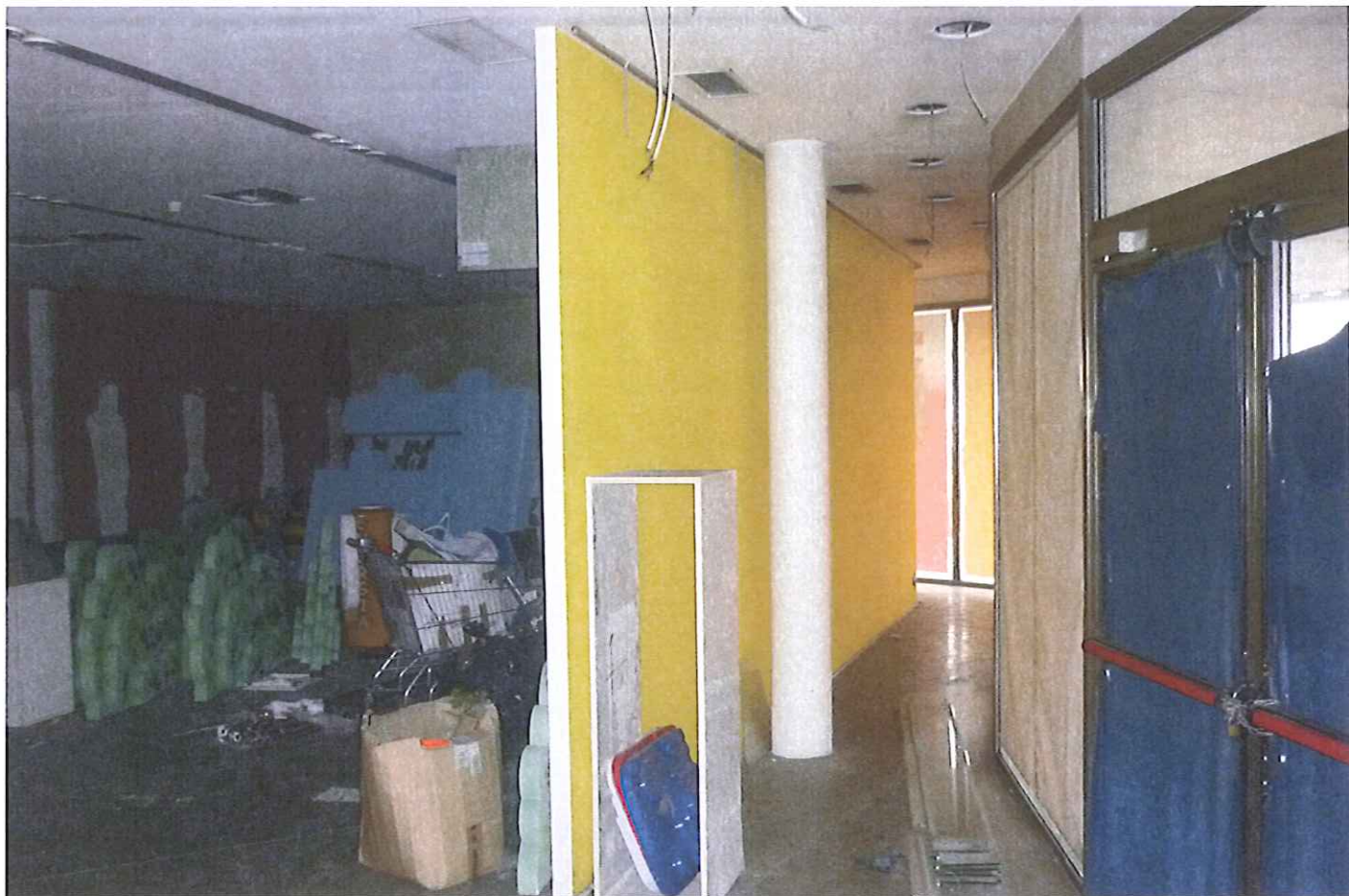
Fabb.E vista interna P.1.