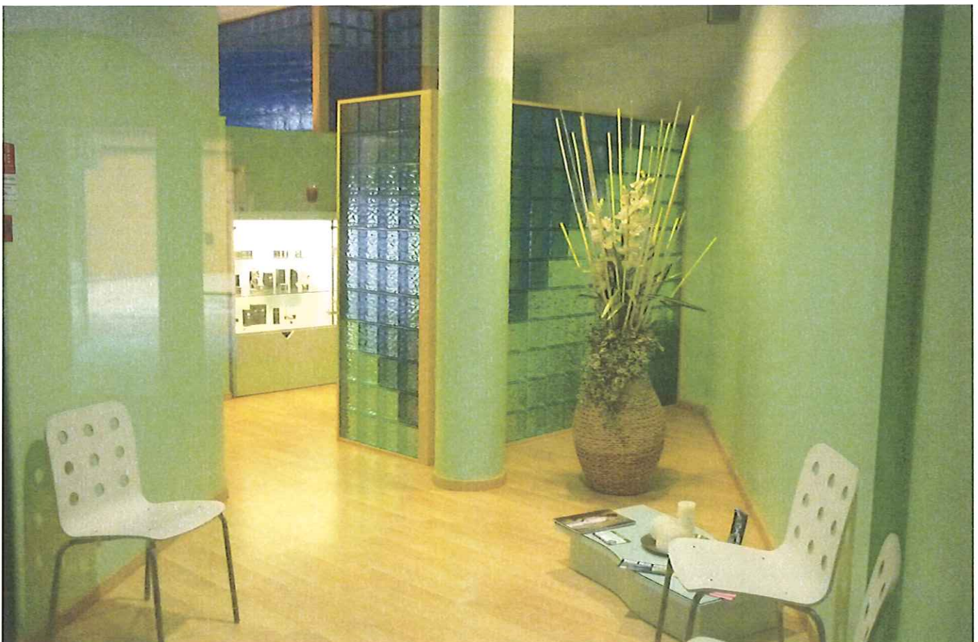
Fabb.E vista interna P.1.