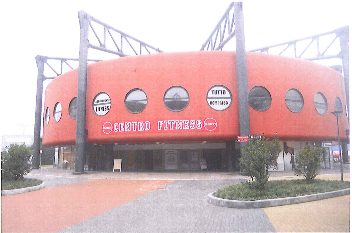
Fabb. E vista da sud-est