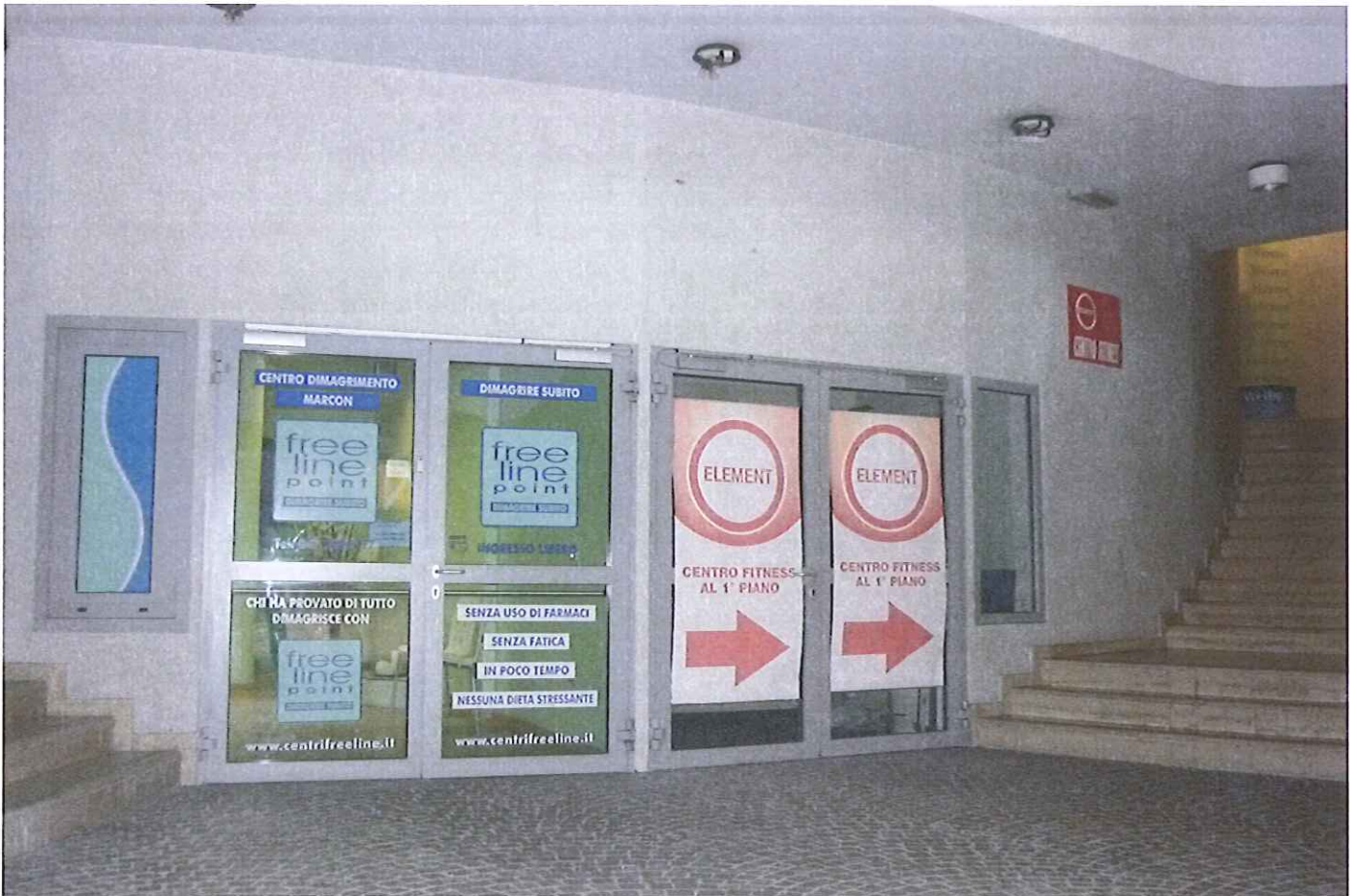
Fabb.E vista interna P.T.