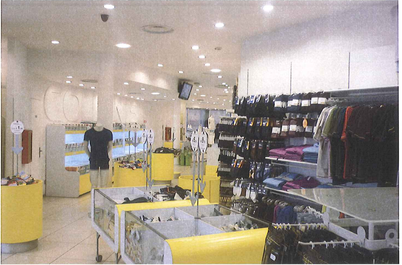
Fabb.E vista interna P.T.