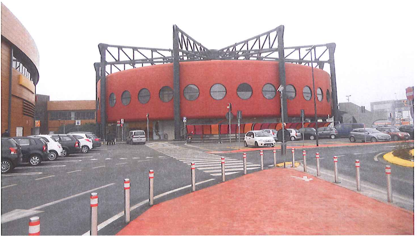
Fabb. E vista da nord