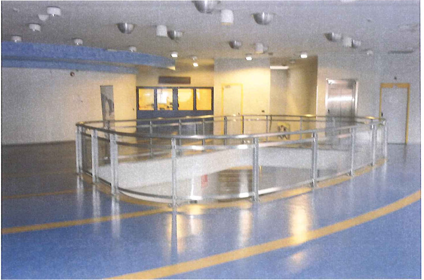
Fabb.E vista interna P.1.