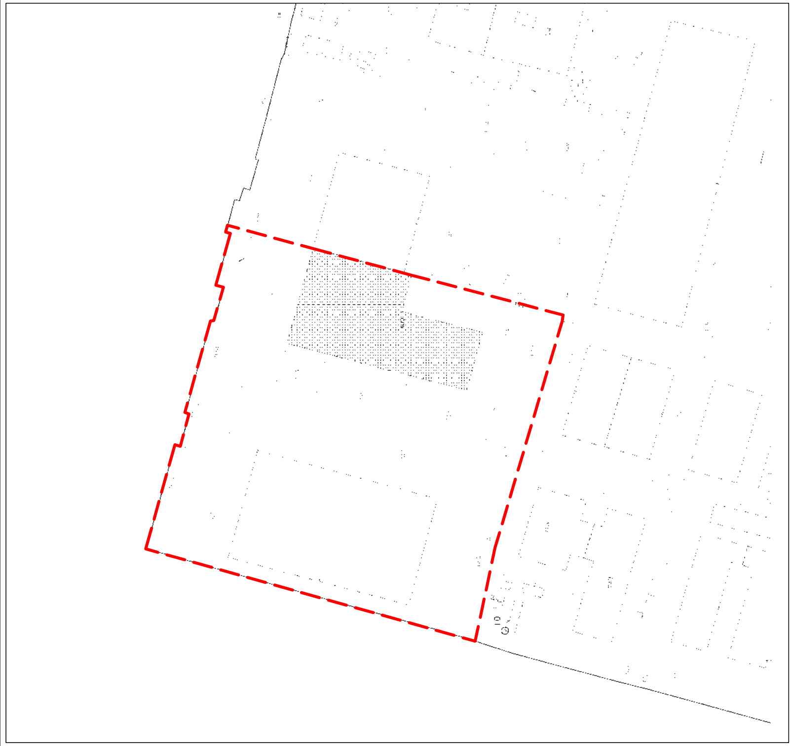
MAPPA CATASTALE SC.1:2000 COMUNE DI MIRANO F.18