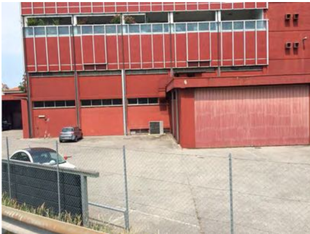
FOTOGRAFIA N° 3