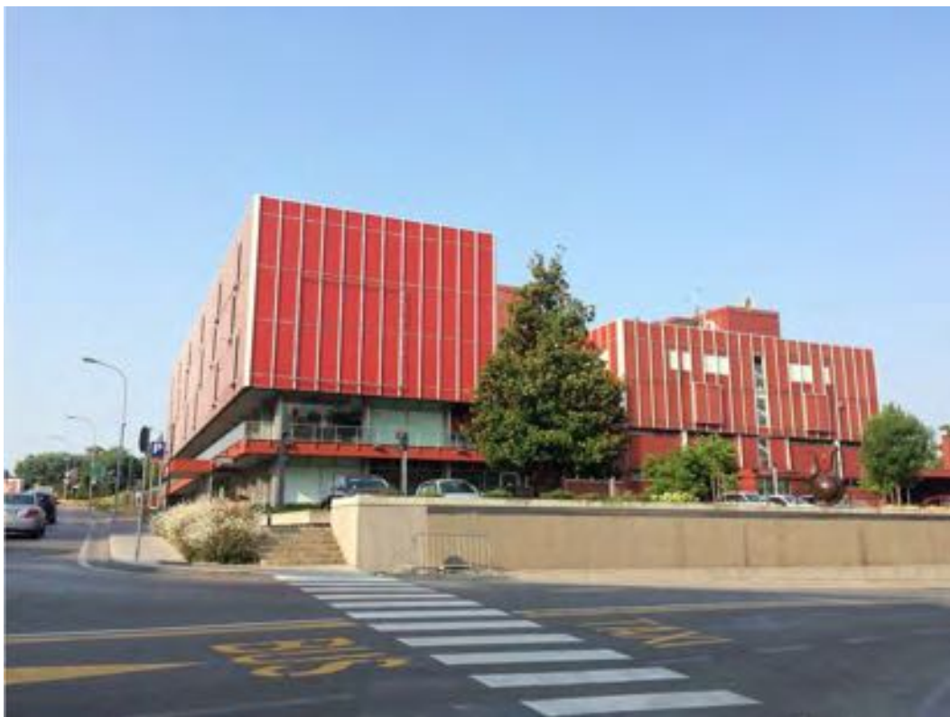
FOTOGRAFIA N° 2