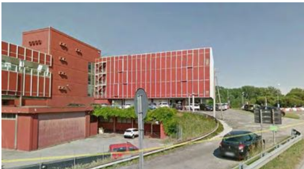
FOTOGRAFIA N° 6