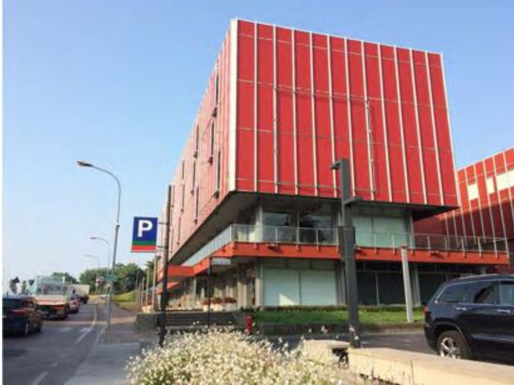
FOTOGRAFIA N° 1