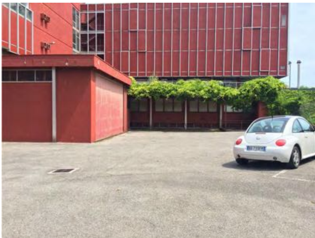
FOTOGRAFIA N° 4