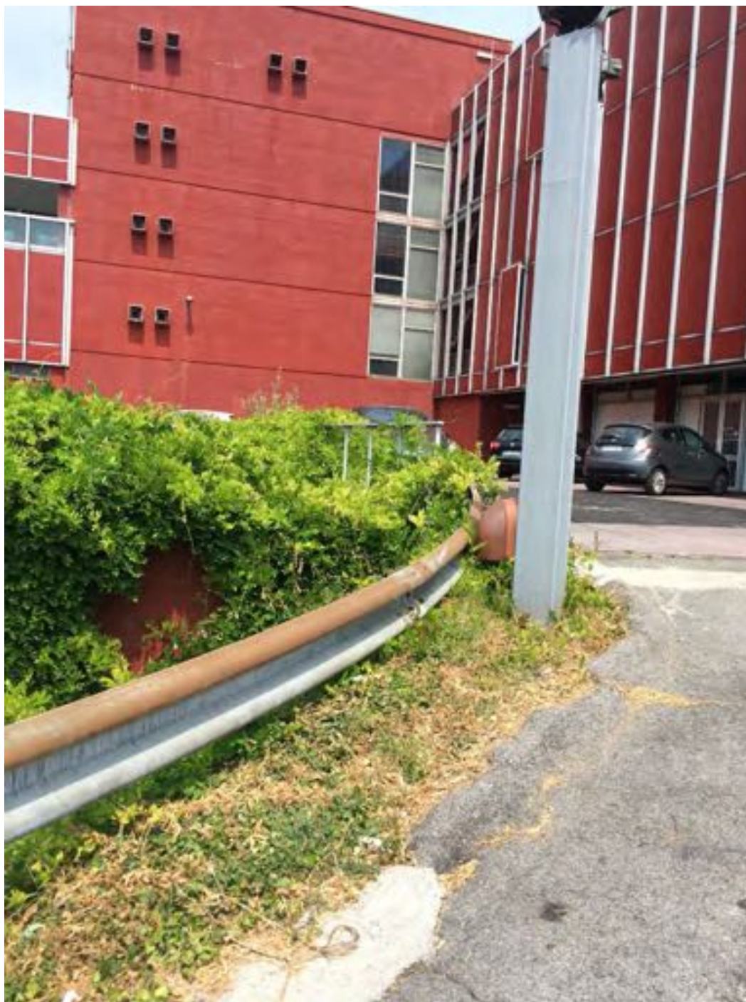
FOTOGRAFIA N° 5